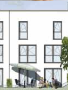
Reihenhaus Nr. 16 Gartenansicht

Beispielhaus: Reihenmittelhaus Nr. 16 Preis: 298.000 EUR Ohne Käuferprovision Ca. 145 m 2 Wohnfläche Ca. 191 m 2 Grundstück