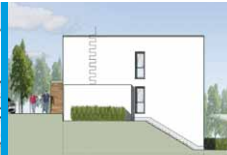
Reihenendhaus Nr. 15 Seitenansicht