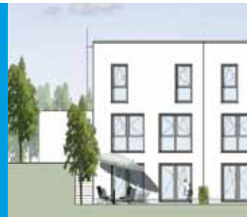
Reihenendhaus Nr. 15 Gartenansicht