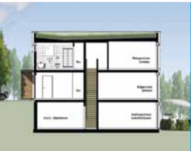
Reihenendhaus Nr. 15 Längsschnitt